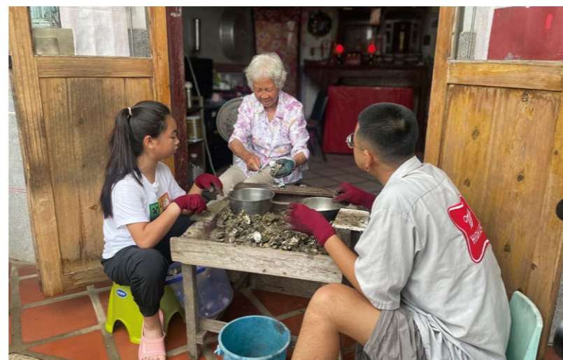
《收成 è 彼一工》

《收成 è 彼一工》主打「以孩子為主角，帶您體驗孩子的日常」。延續前兩季，觀眾將看到更多不同行業家庭裡孩子的故事，像是：