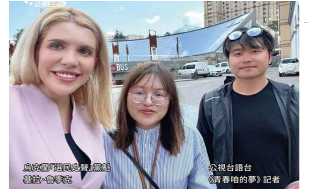
臺語台記者在烏克蘭採訪

各種地方公共事務和議題，請專家來賓上節目和主持人共同討論。我們也走訪地方，採訪各地人物，製作議題式專題；跟隨著新聞時事和節氣，也教觀眾看新聞學台語、說台語。另有《啾茶配話》邀來賓討論發燒話題，《南國真情味》報導地方人物和議題，《新聞台語》帶大家認識各種新聞臺語詞。