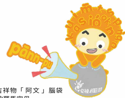
臺語台開發的IP吉祥物「阿文」腦袋上都是台文所使用的羅馬字母

2023年《公共電視法》修法通過，標誌著公共媒體的轉折點，也為多元族群頻道提供了法制基礎。在變革的新時代，古老的台語有了新的舞台，撐起台灣文化韌性的底氣。公視臺語台致力台語文詞彙的推廣、活化、傳承，以全媒體，擴大臺語台的觸及面並加深品牌辨識度。而南部中心的啟用，更讓臺語台進一步活化在地連結。