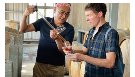
（上）《這是台灣款》（下）《無事坐巴士》