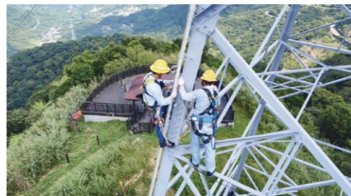
頻道包裝短片「看顧」，紀錄在台灣各角落認真打拚的勞動者身影

本年度在頻道包裝的規劃上，臺語台推出「看顧」系列短片。取材自台灣較罕見或較少被關注的勞動者，如水庫警察、防汛志工隊、航空測量員等等。透過紀錄他們在各個角落認真打拚的身影與容顏，描繪在這塊寶島之上，諸多職人匠心默默付出、用自己的方式守護台灣這塊土地之動人精神。