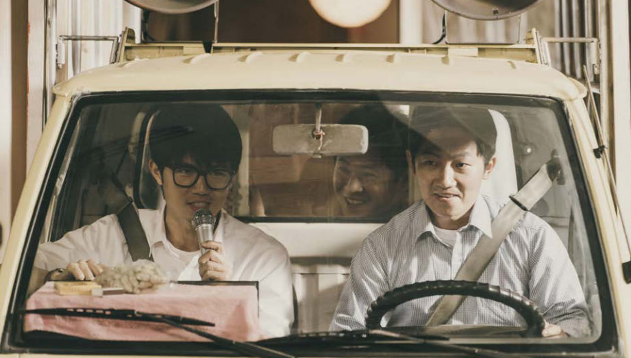
《鹽水大飯店》宣傳車上，仁煌開車、文欽廣播，阿德發放人權宣傳單