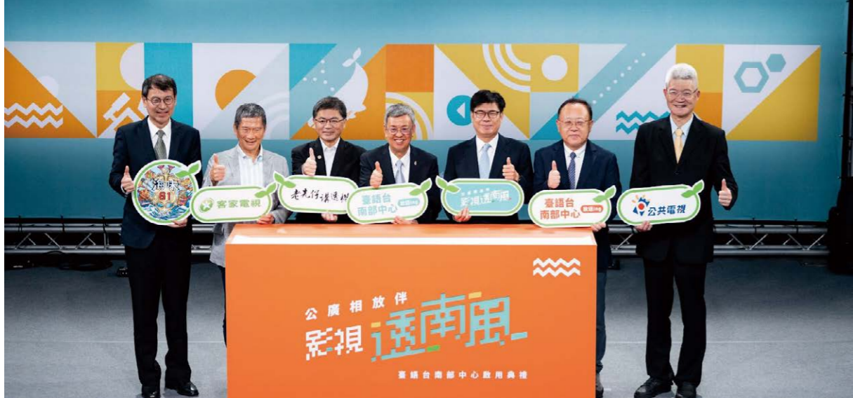
行政院長陳建仁（右4）、文化部長史哲（右2）、高雄市長陳其邁（右3）及公廣集團董事長胡元輝（右1）等人一同見證南部中心的啟用

台北與夾腳拖劇團合作，開設「台語兒童表演人才培訓」課程；在高雄與豆子劇團合作，推出台語兒童戲劇營；並與成功大學合作，邀請台內製作單位從不同面向分享台語媒體製播經驗。