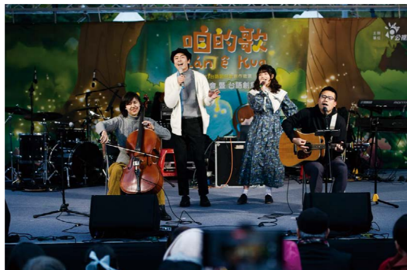
《咱的歌》台語囡仔歌創作徵選發表會，創作者演唱入選作品

2023年臺語台推出《WAWA哇!》、《穎仔穎仔育》等節目作品，也開始邁出腳步前進雙北及桃園的七所幼兒園，以台語兒歌《兩隻海豹》與《來跳舞》帶動唱，讓七百多名學齡前的孩子認識台語。此外，臺語台也嘗試在