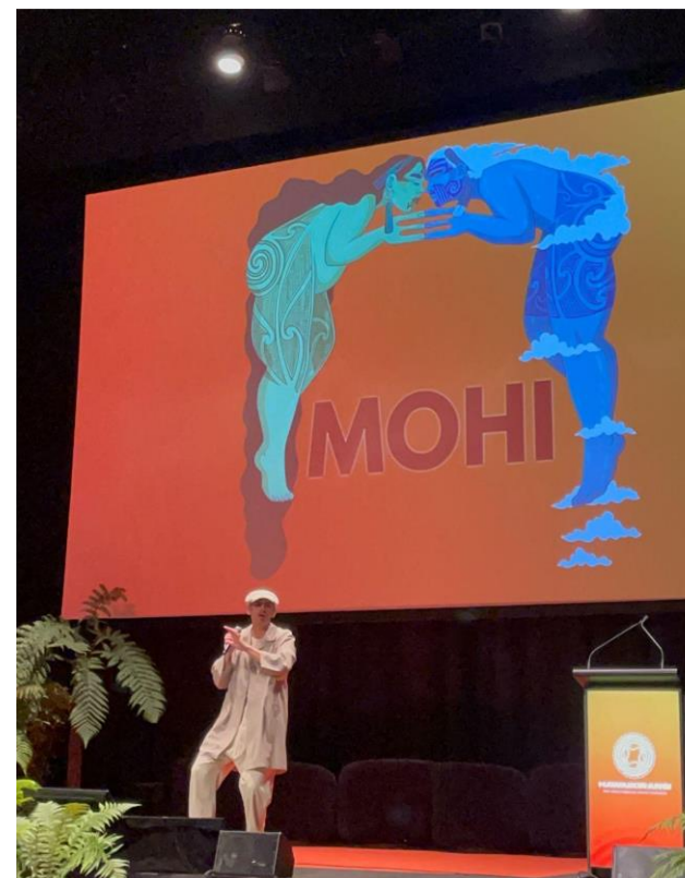
安排毛利歌手串場演出。