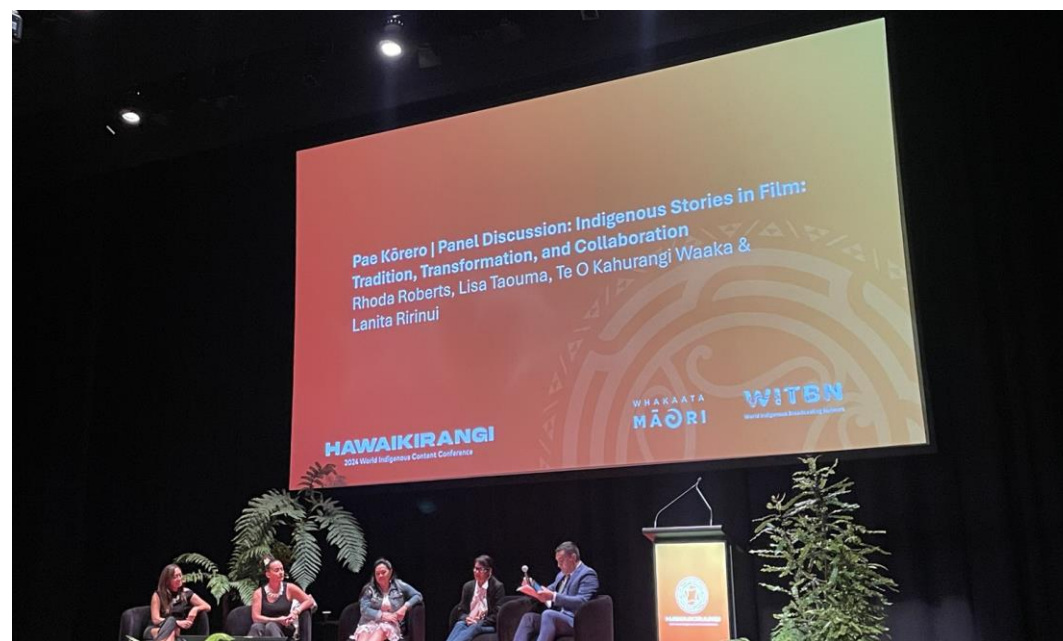
透過綜合座談，共同探討如何由原住民的故事出發，產生影響力。