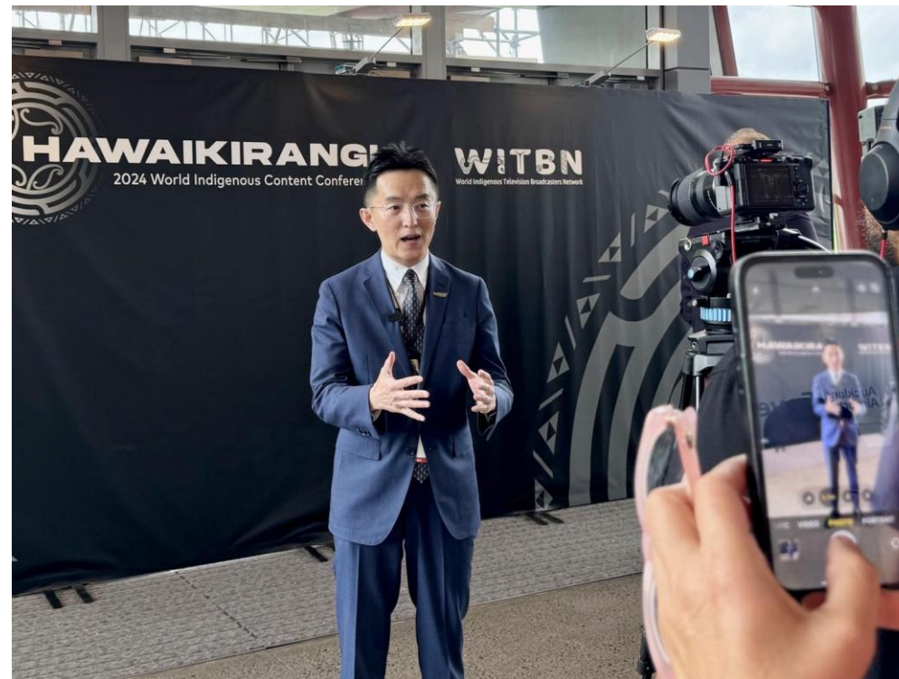
向台長於WICC期間，接受外媒訪問。