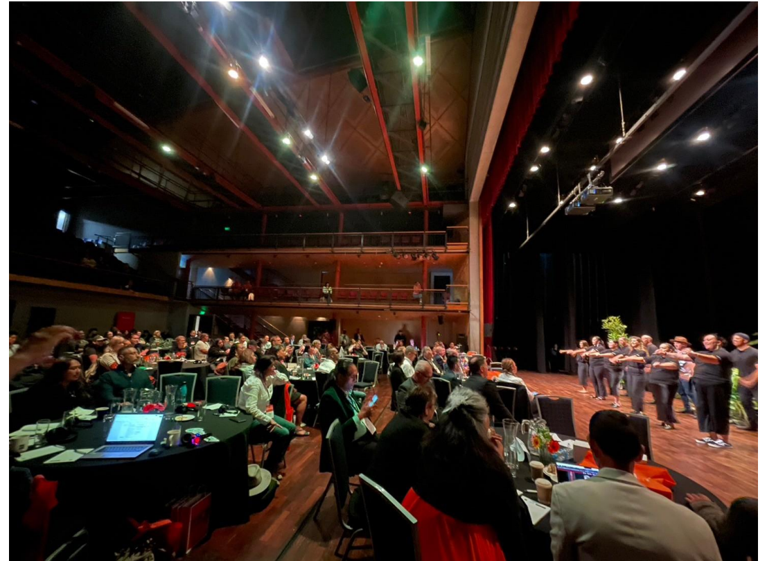
論壇場次間的中場休息，皆由毛利台員工表演傳統歌曲，除令人在會議中提振精神，也讓與會者自然而然跟著吟唱。