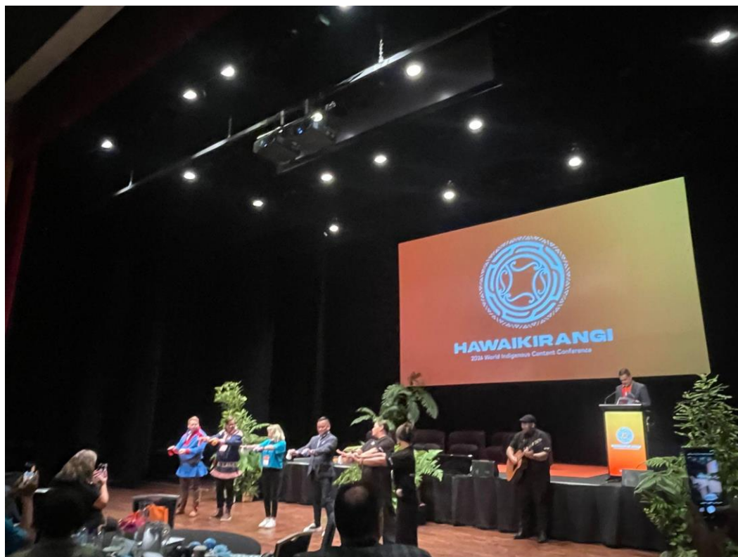
場次休息期間安排毛利傳統遊戲，並邀請來賓上台互動。