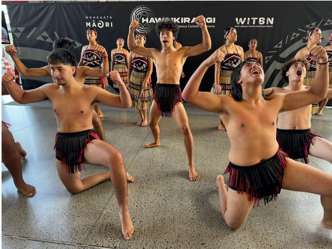
開幕時安排毛利戰舞表演。

在此次兩天的議程中，從開幕的表演、大銀幕的雙語呈現、口譯（毛利語轉英語，因毛利講者皆會大量使用毛利詞彙）、至場次間的中場休息表演、互動遊戲、處處皆讓與會者自然而然的接觸毛利文化，且印象深刻。是未來舉辦相關活動很好的借鏡。