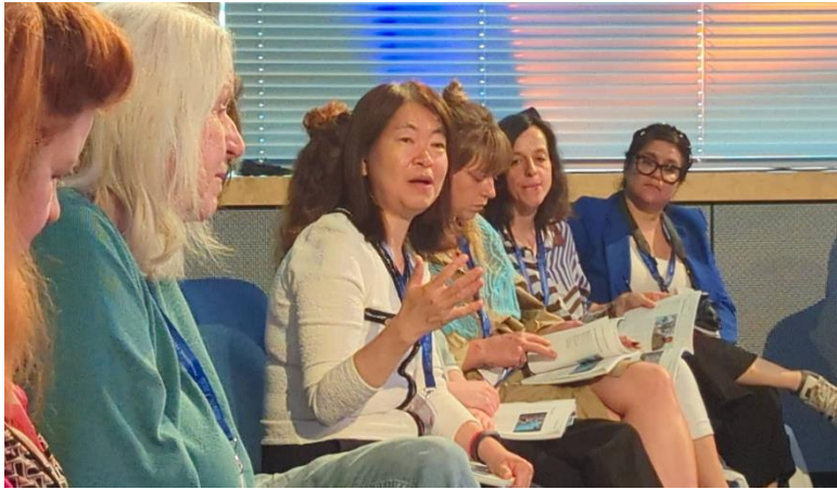
參與節目映後討論

類似型態的節目(透過訪談鼓勵孩子藝術創作)，但其深度和想像不如本節目，也未能加上歷史影像素材的運用。