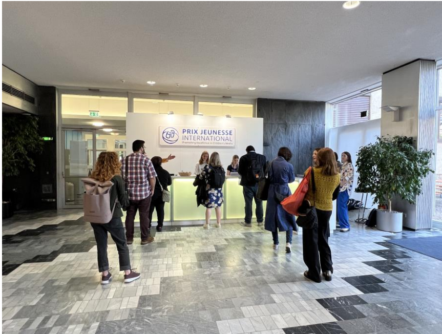
慕尼黑國際兒少影展現場服務台