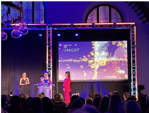
大會頒獎典禮現場

值得注意的是，台灣節目「登山總動員」首次在這個影展的正式獎項中奪得最後的首獎，非常值得喝采。「海洋日記」在 11—15 非劇情類別中奪下第二，雖然沒能拿到首獎，也已經十分不容易。「對手的秘密」也在 7—10 歲非劇情類中拿下第二名。「一百年後的我，你好嗎？」則在 7-10 歲非劇情類中排名第五，成功擠進前五名的入圍名單。整體而言，今年 7-10 歲非劇情類別，前五名就有三部台灣作品，打破過去所有紀錄，也凸顯了台灣在兒少節目製作方面的整體成果。