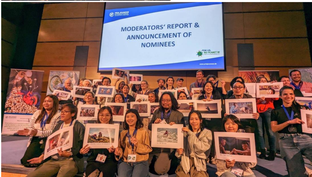
(下圖) 台灣三個節目進入最後提名