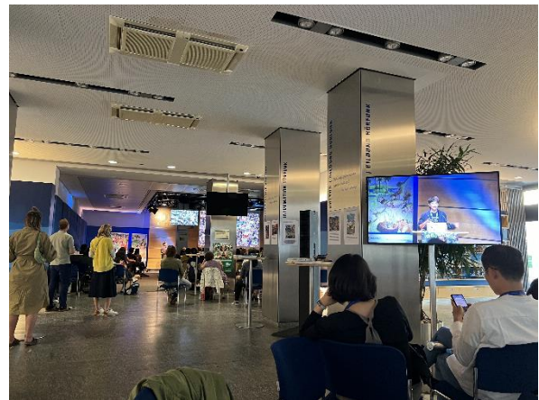
氣候議題專場的現場

本屆慕尼黑國際兒少影展的主題是「我們只有一個地球！兒少電視節目與永續發展」(For Us, No Planet B! Kids TV and Sustainability)，因此大會特別安排了氣候議題專場，闡述氣候問題的嚴重性與迫切性，並說明為何要定調這個主題，嘗試透過節目製作喚起全球兒少對這個議題的瞭解與認識，並付諸行動，締造改變。