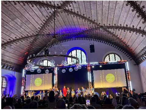
大會頒獎典禮現場

當晚，大會在慕尼黑的舊市政廳 Altes Rathaus 舉辦了隆重的頒獎典禮，現場揭曉每個獎項最後的得獎者。本屆六個主要類別的得獎節目如下：