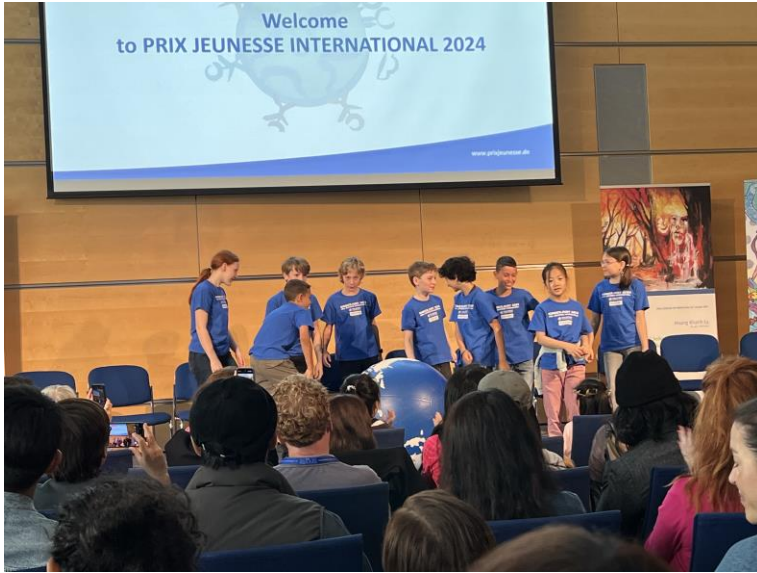
德國兒少評審團 成員