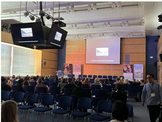
慕尼黑國際兒少 影展看片現場