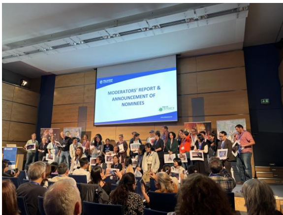
(左圖) 大會宣布提名的現場

大會在蒐集與會者的票選結果，並進行最後統計之後，於 29 日下午，公開宣布了每個獎項前三名的入圍者，台灣節目「海洋日記」、「登山總動員」、「對手的秘密」都在入圍之列。