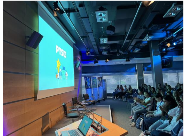
公視兒少頻道/平台宣傳短片，以及小公視 LOGO 在現場露出