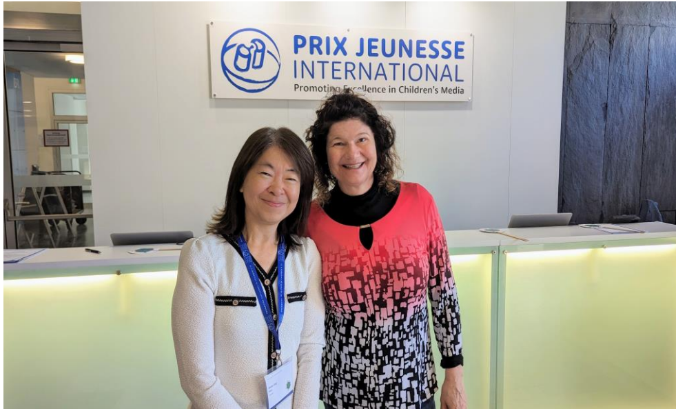
(右) 德國慕尼黑國際兒少影展主席 Dr. Maya Götz

本屆慕尼黑國際兒少影展 Prix Jeunesse 從 5 月 23 日開始，一直進行到 5 月 29 日，主要活動共計 6 天，但影展前一天有展前工作坊，針對製作面的主題進行特定分享。從 24 日開始，則針對不同的類別，逐一進行影片放映與評選。值得一提的是，在這個影展，放映與投票不是最主要的活動，在影展期間，真正最重要的，其實是每個類別播映完畢之後的現場討論，這是交換幕後製作心得最重要的場域，也是向(在場)製作團隊請教各項製作要訣的最佳良機。而為了讓與會者盡可能有更多發言的機會，大會特地請五位主持人，分別在五間不同的會議室，同時主持五個現場的討論，每位主持人依其主持風格的不同，會讓現場的討論有不同的火花，而與會者則可以按照本身的需求與想法，隨機參與任何一場的討論活動。