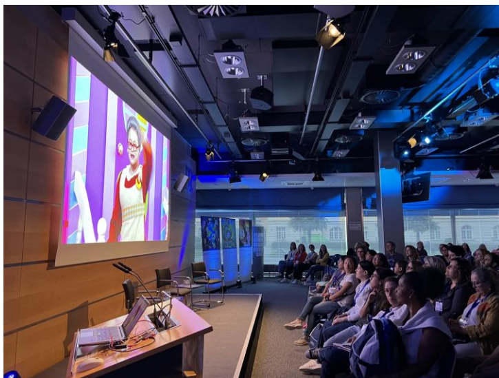
公視兒少節目經典人物 水果奶奶在現場宣傳影 片中亮相