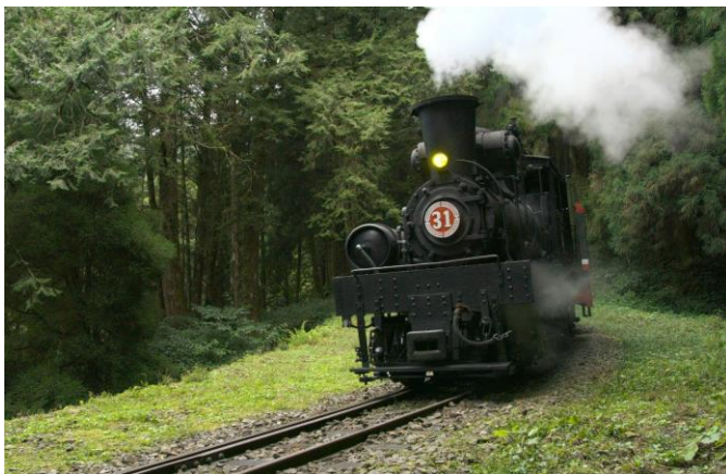
06 《神木之森：阿里山森林鐵道紀行》拍攝台灣阿里山森林鐵道風貌