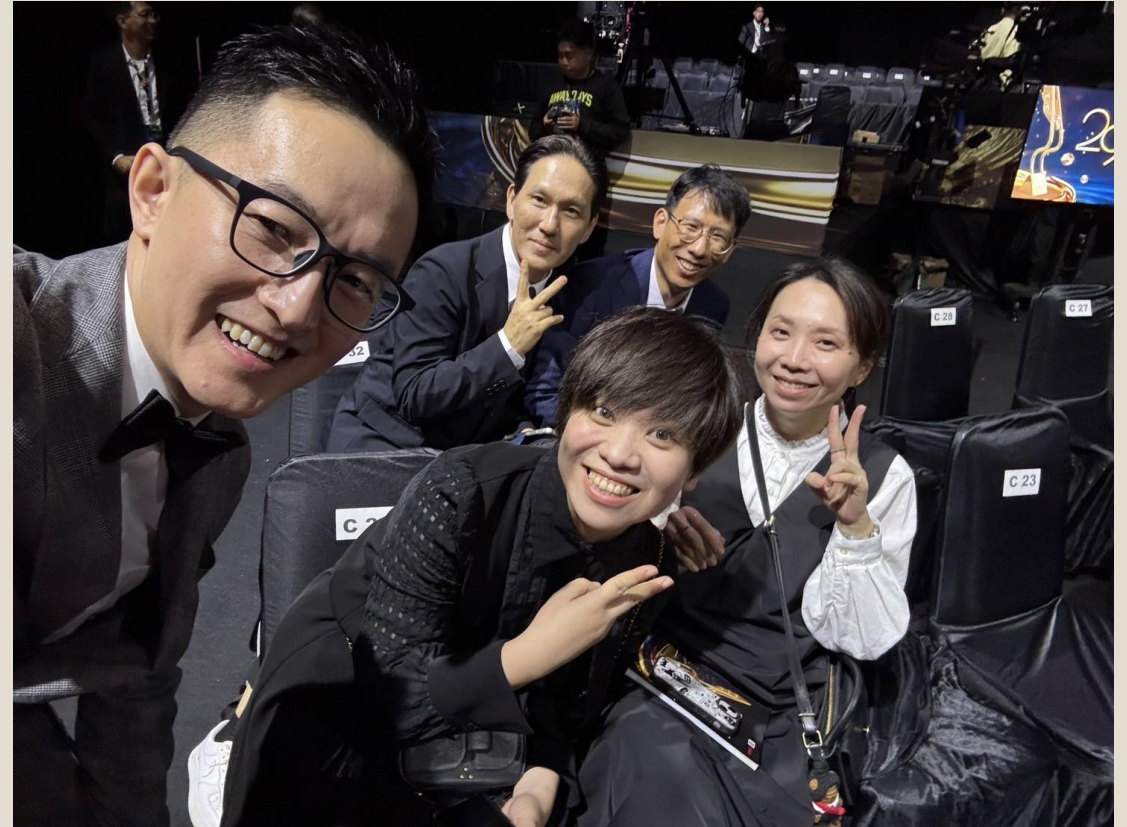
參與第一天頒獎典禮，與各國影視人員交流，右圖為與客家電視台參與同仁合照