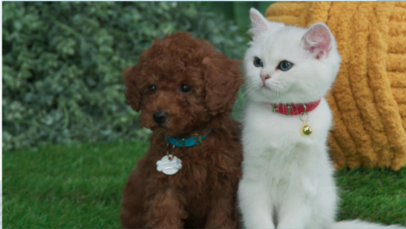
Mittens & Pants