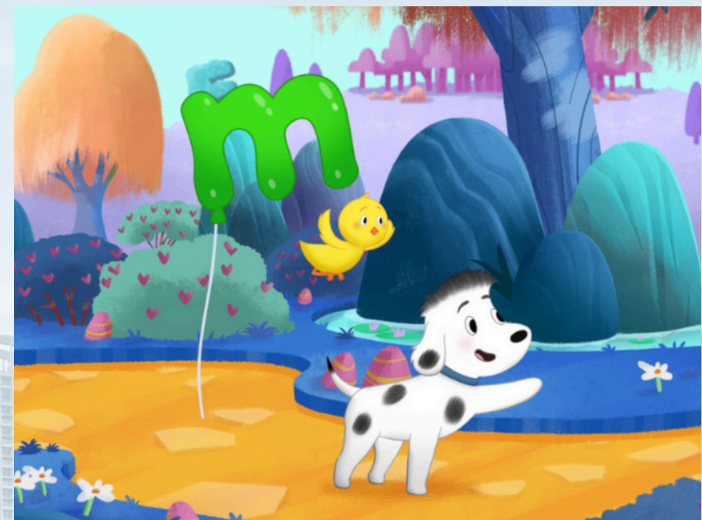
Rocket Saves the Day

Thunderbird Entertainment是加拿大知名的大型娛樂暨發行公司，旗下更網羅了知名動畫公司Atomic Cartoons，擁有非常多知名動畫品牌。